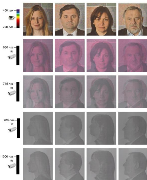
Slika 3. Zaštita četiri reprodukcije anfas portreta osoba sa pripadnim sigurnosnim portretom profila vidljivim od 630 nm do 1000 nm u NIR-Z području

Ekperimentalni rezultati prikazani su na slici 3. Na slici su u prvom retku prikazane reprodukcije 4 anfas portreta vidljiva u vidljivom dijelu spektra. U svakom slijedećem retku se vide detektirani odzivi tih istih reprodukcija u valnim duljinama redom: 630 nm, 715 nm, 780 nm i 1000 nm. Na 1000 nm, odnosno u NIR-Z području, se u potpunosti vidi portret profila iste osobe čiji se anfas portret vidi u vidnom djelu spektra.