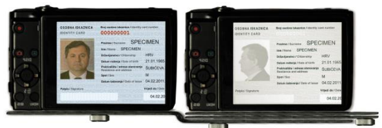
Slika 4. Prototip osobne iskaznice s ugrađenim dualnim portretom prikazan preko ZRGB kamere za dualno gledanje

Na slici 4 je prikazan eksperimentalno izveden prototip osobne iskaznice s ugrađenom zaštitom u portret osobe tako da ga se nemože krivotvoriti fotokopiranjem ili skaniranjem. Rezultat eksperimenta se vidi pomoću ZRGB sustava za dualno gledanje [9] gdje jedna kamera validira VS portret (standardna kolor kamera), druga koja provjerava oku skriveni portret u NIR-Z području.