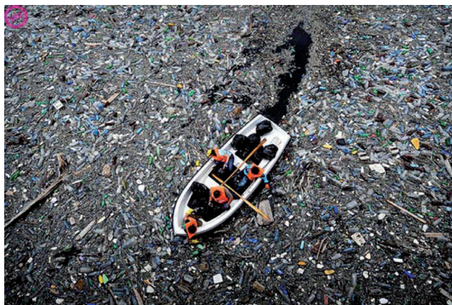
Krichim, Boat in plastic, April 25, 2009.

Jesu li dizajneri suodgovorni za globalno zagađenje svijeta? Dobrim dijelom jesu, budući da su u prilici sugerirati korištenje brzorazgradive plastike, jednako kao i povratak na ambalažiranje s povratnom staklenom ambalažom, vraćanje na čekere, mrežice, platnene torbe. Dizajner bira vrstu ambalaže i materijal, količinu slojeva u opremi proizvoda. Ekološka osvještenost proizvođača i potrošača uravnotežuje se u postupcima dizajnera. Dizajner je dio tima koji odlučuje o proizvodu i suradnik marketinške ekipe savjetnika.