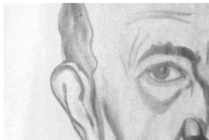
V Slika 4: Z

Slika: Detalj slike u vizualnom i bliskom IR spektru na 1000 nm