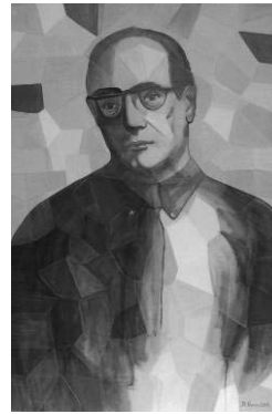
Slika 1: V