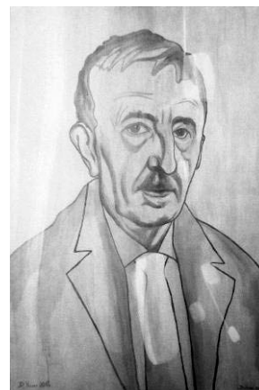
Slika 3: V